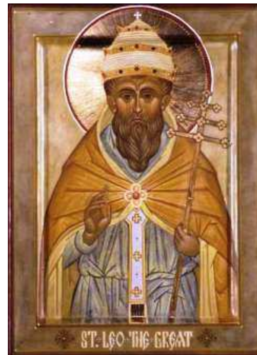
СВ. ПАПА ЛЕВ.